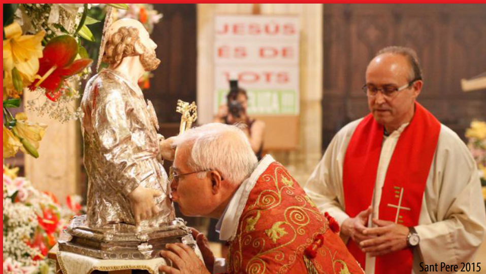
Sant Pere 2015